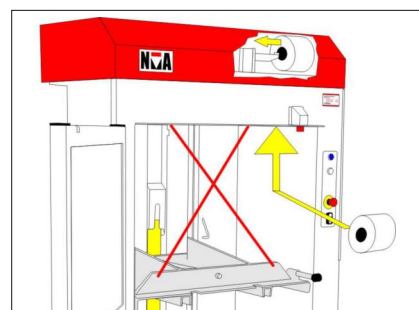
Balbanden är lätt åtkomliga framifrån. Varje band kan bytas enskilt.